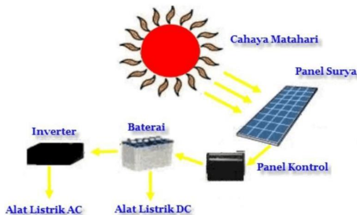
Gambar 1. Proses panel listrik tenaga surya

Efek photovoltaic menyebabkan arus mengalir di antara lapisan N dan P yang memiliki muatan berlawanan, hal ini dapat terjadi jika suatu bahan menyerap foton dengan energi di atas suatu batas tertentu (Lubis, 2022).