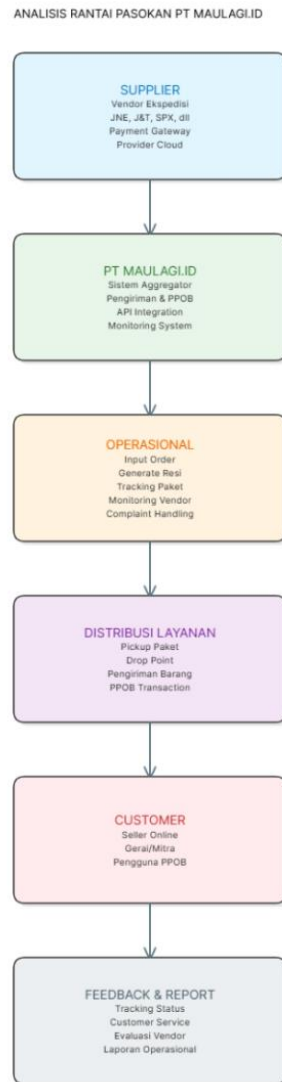
Gambar 3. Rantai Pasokan PT Maulagi.id

Analisis rantai pasokan digunakan untuk melihat bagaimana aliran layanan, informasi, dan teknologi berjalan dari supplier hingga pelanggan pada PT Maulagi.id. Dalam perusahaan berbasis digital seperti Maulagi.id, rantai pasokan tidak hanya melibatkan distribusi barang, tetapi juga integrasi data, layanan digital, dan pengelolaan informasi secara real-time [5]. Pada tahap supplier, PT Maulagi.id bekerja sama dengan berbagai vendor ekspedisi seperti JNE, J&T, SPX, Lion Parcel, SAP Express, dan ID Express untuk mendukung layanan pengiriman barang. Selain itu, perusahaan juga menggunakan